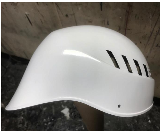
Capacete fornecido com a proteção em aço inox como mostra a imagem do atleta abaixo