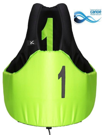
Colete polo hiko sport com certificado ICF